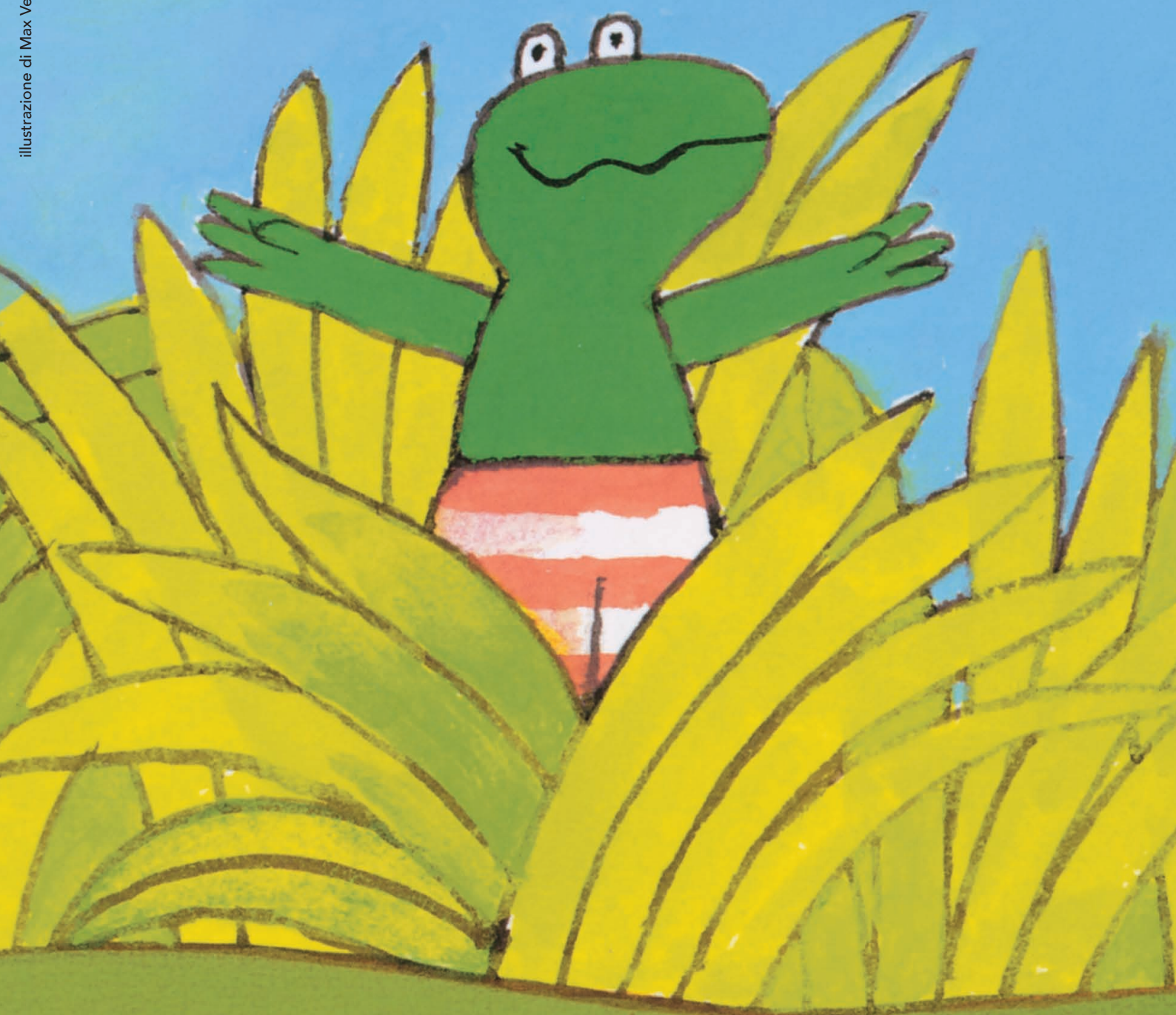
illustrazione di Max Velthuijs