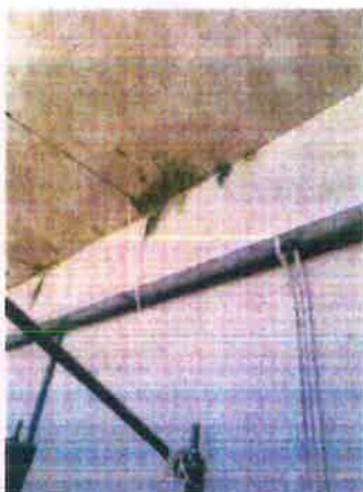
ZONA ACCESSO FALGNAMERIA DEP. ELETTRICO foto 7