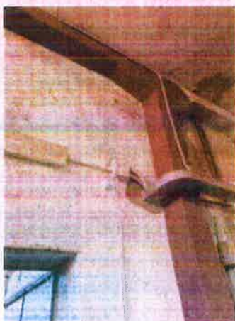
SCALA EMERGENZA CAMERONI foto 8