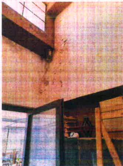
AREA ACCESSO FALEGNAMERIA foto 2