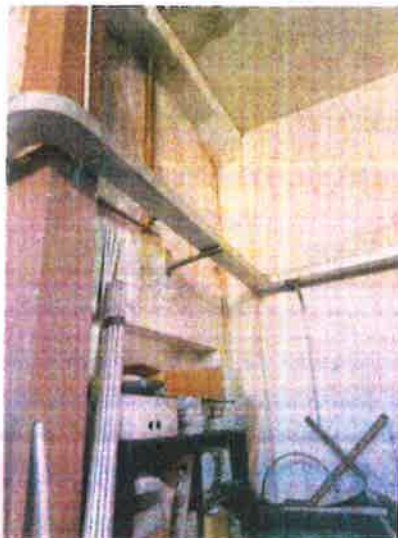
AREA FALEG. LAB. ELETTRICO foto 4